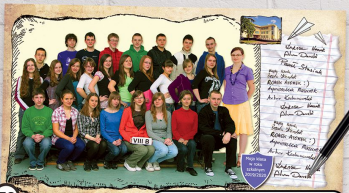
39 Zdjęcie grupowe na specjalnym papierze, na którym można zapisać listę zaszereżone 15x27 cm cena 17 zł

REALIZACJA PRZY ZAMÓWIENIU TYLKO JEDNEGO WZORU DLA KLASY