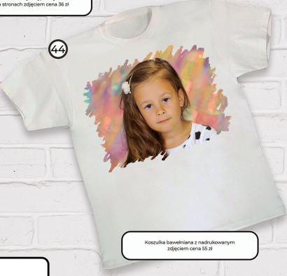
44 Koszulka bawełniana z nadrukowanym zdjęciem cena 55 zł