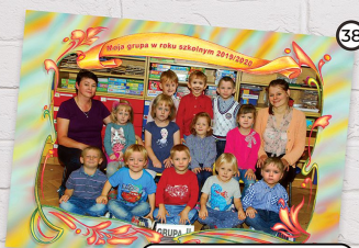
38 Zdjęcie grupowe z nakładką cyfrowo ramką 15x27 cm cena 15 zł

REALIZACJA PRZY ZAMÓWIENIU TYLKO JEDNEGO WZORU DLA KLASY