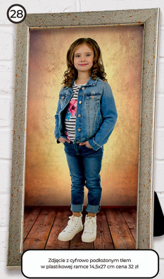
28 Zdjęcie z cyfrowo podłożonym tłem w plastikowej ramce 14,5x27 cm cena 32 zł