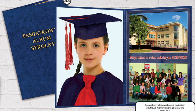
33 Pamiętnik album szkolny z portretem z cyfrowo mroczoną kopią 30x45 cm cena 37 zł