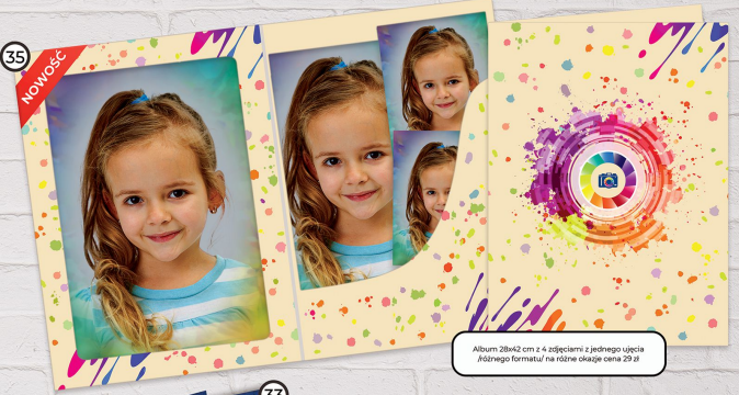
35 Album 28x42 cm z 4 zdjęciami z jednego ujęcia (różnego formatu) na różne okazje cena 29 zł