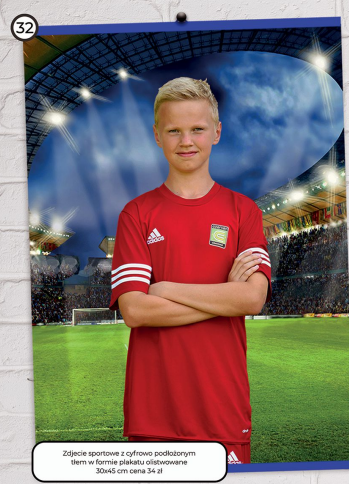
32 Zdjęcie sportowe z cyfrowo podłożonym tłem w formie plakatu olistwowane 30x45 cm cena 34 zł