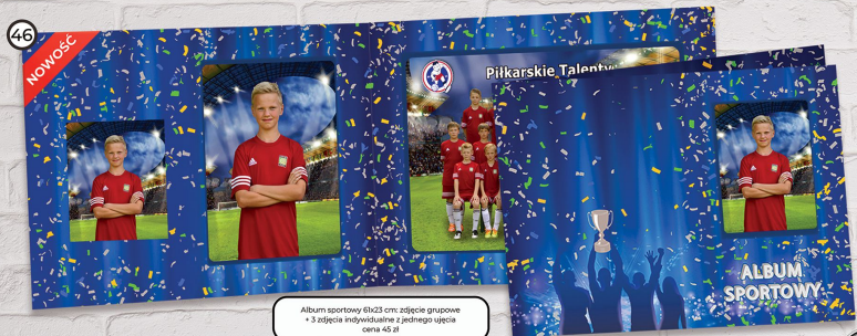
46 Album sportowy 61x23 cm; zdjęcie grupowe + 3 zdjęcia indywidualne z jednego ujęcia cena 45 zł