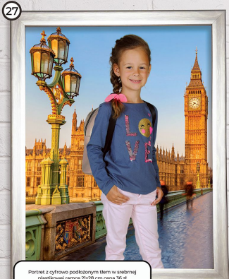
27 Portret z cyfrowo podłożonym tłem w srebrnej plastikowej ramce 21x28 cm cena 36 zł