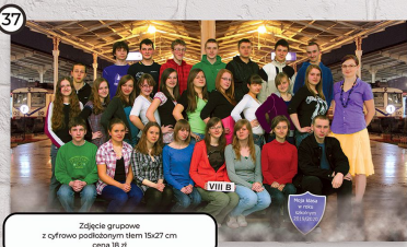
37 Zdjęcie grupowe z cyfrowo podłożonym tłem 15x27 cm cena 18 zł