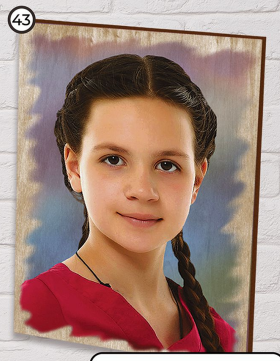
43 Portret drukowany na drewnie 15x27 cm cena 35 zł