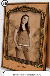
36 Zdjęcie w sepi w ramce tekturnej 17x24 cm cena 27 zł