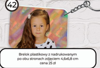
42 Brelok plastikowy z nadrukowanym po obu stronach zdjęciem 4,6x6,8 cm cena 25 zł