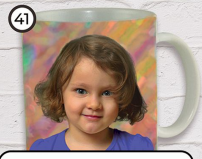
41 Kubek ceramiczny z wypalonym po dwóch stronach zdjęciem cena 36 zł