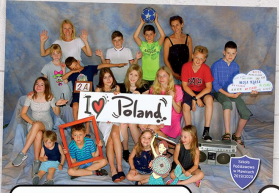
40 Zdjęcie grupowe aranżowanie 15x27 cm (zobowiązanie we własnym zakresie) cena 10 zł