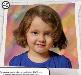
45 Szyrona pozycja na podłożu 38x38 cm z nadrukowanym zdjęciem cena 39 zł